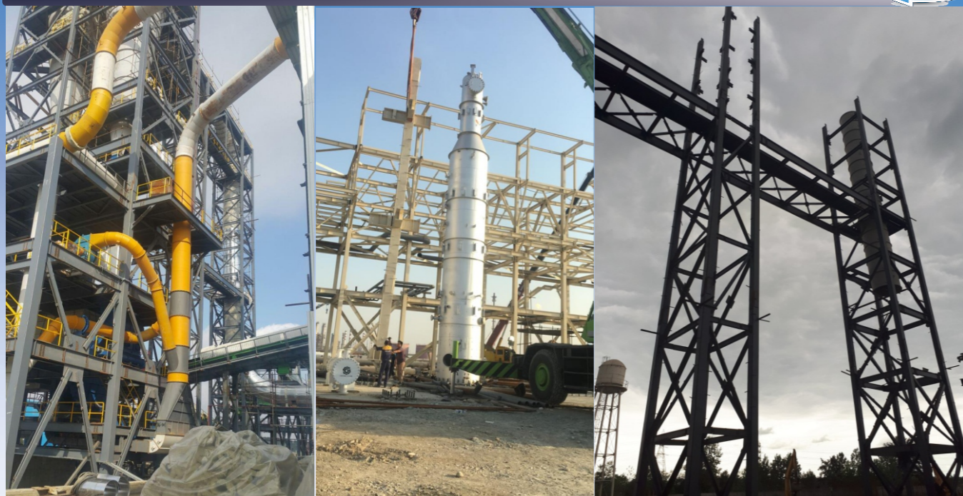
طراحی، ساخت و اجرای انواع نوارنقاله، برج های تقطیر و انواع سازه های خرابی