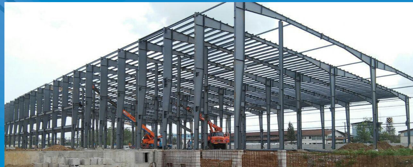
طراحی، ساخت و اجرای انواع سازه های فلزی صنعتی (سوله)