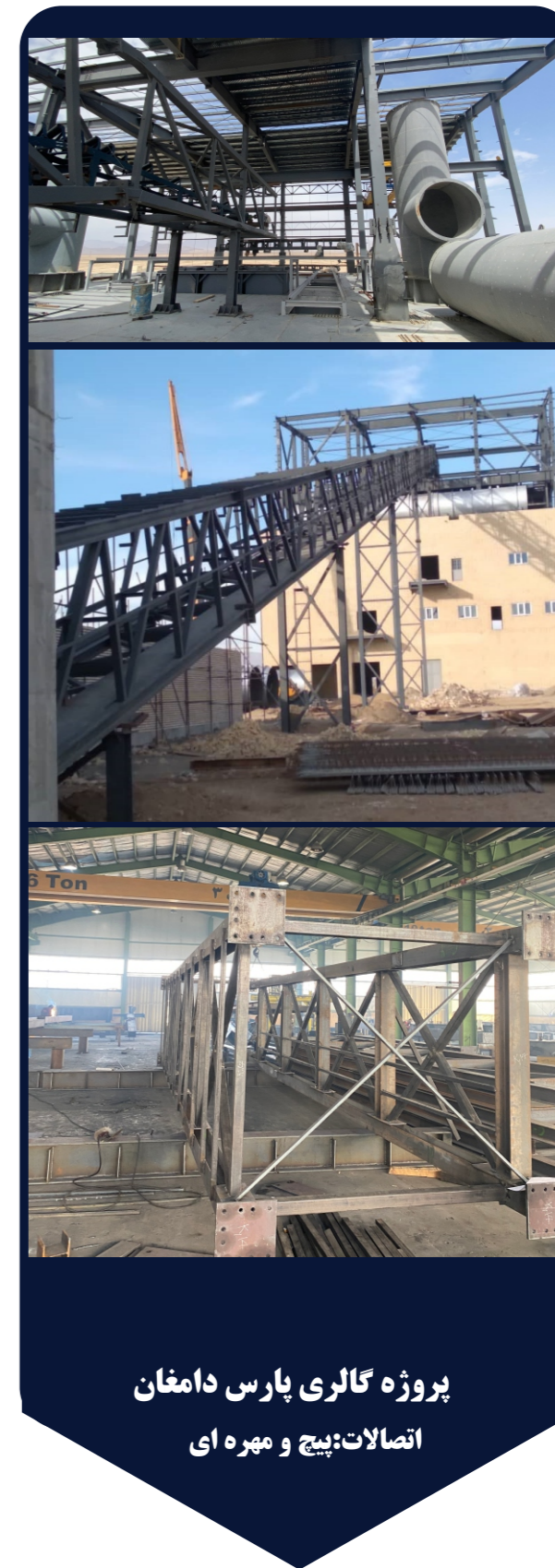
پروژه گالری پارس دامغان اتصالات: پیچ و مهره ای