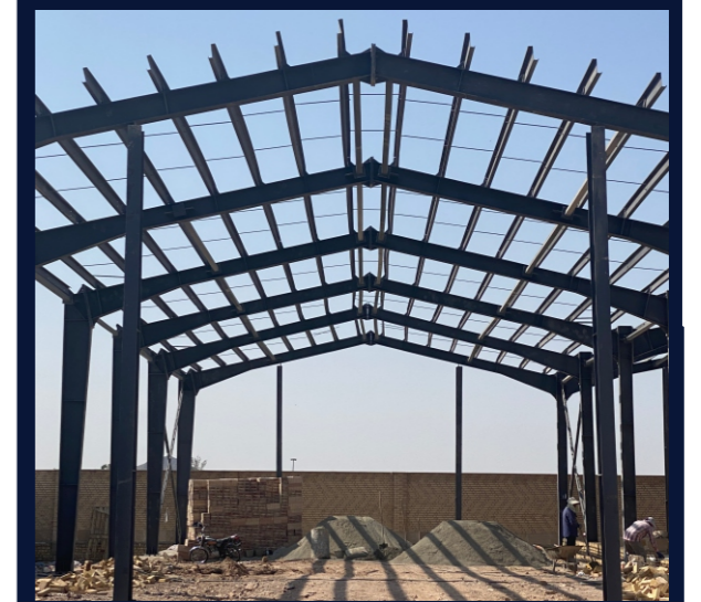
پروژه سوله های آرتا ایرانیان اتصالات: پیچ و مهره