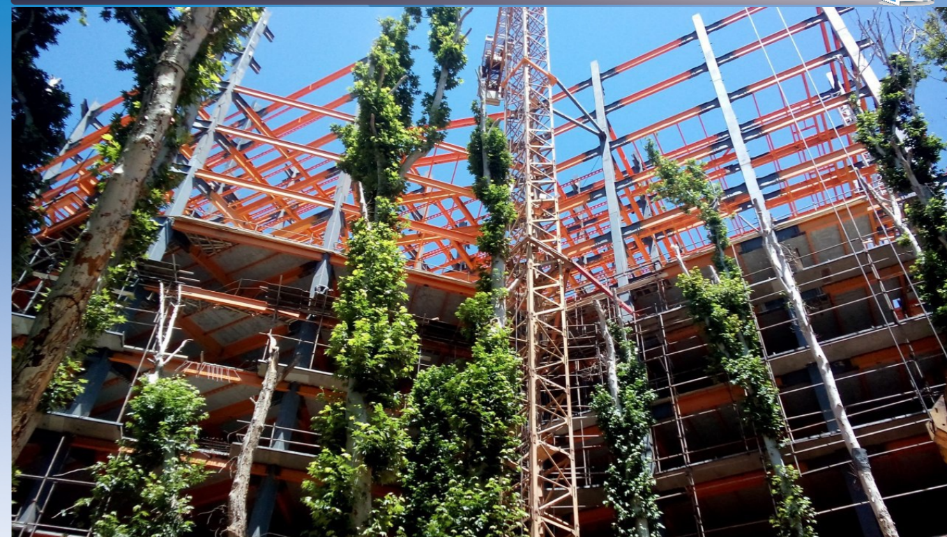
طراحی، ساخت و اجرای برج های مسکونی، تجاری و اداری با اتصالات پیچ و مهره و جوش