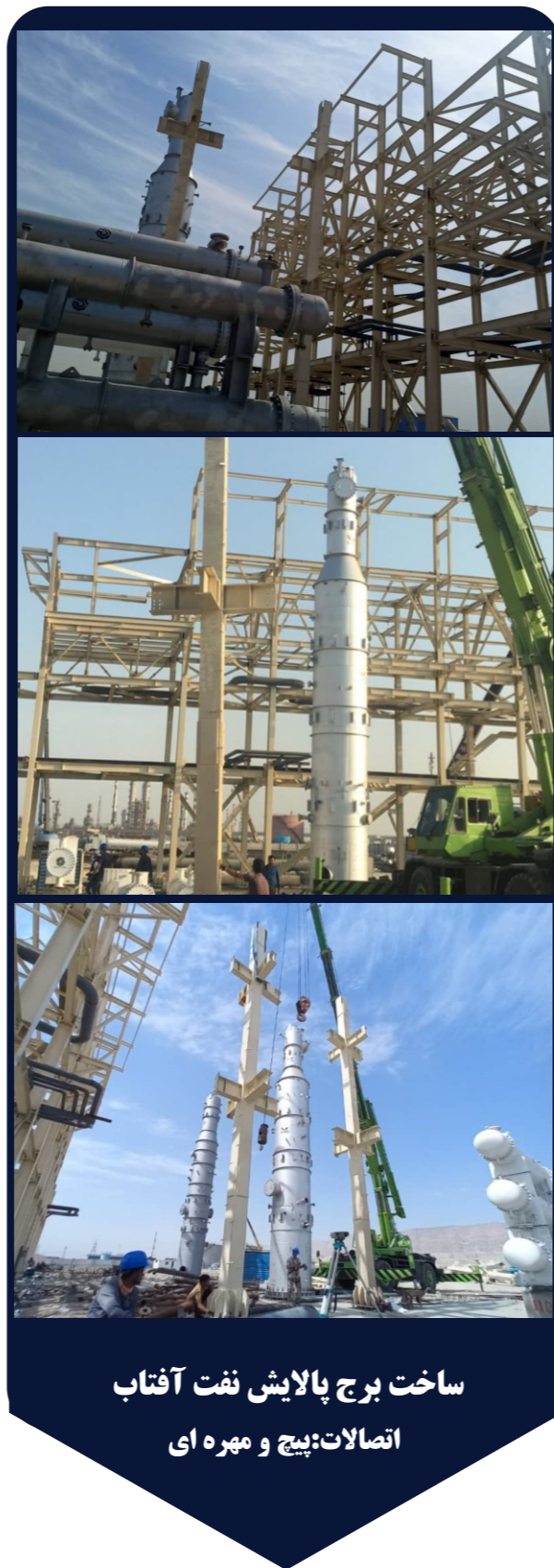
ساخت برج پالایش نفت آفتاب اتصالات: پیچ و مهره ای