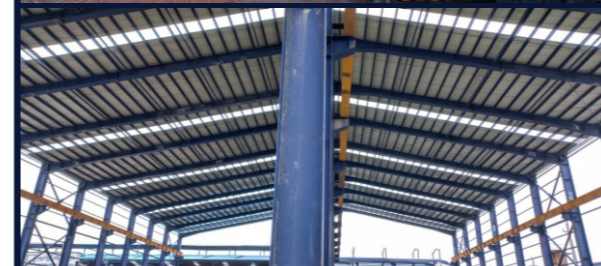
پروژه سوله صنعتی آریا ذوب اتصالات: پیچ و مهره