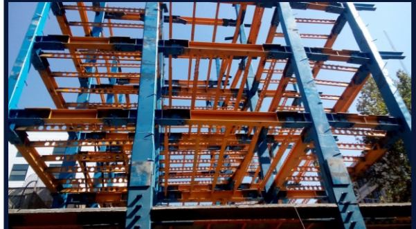
پروژه مسکونی پاسداران اتصالات: پیچ و مهره