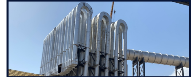
پروژه یوتیوب اتصالات: پیچ و مهره