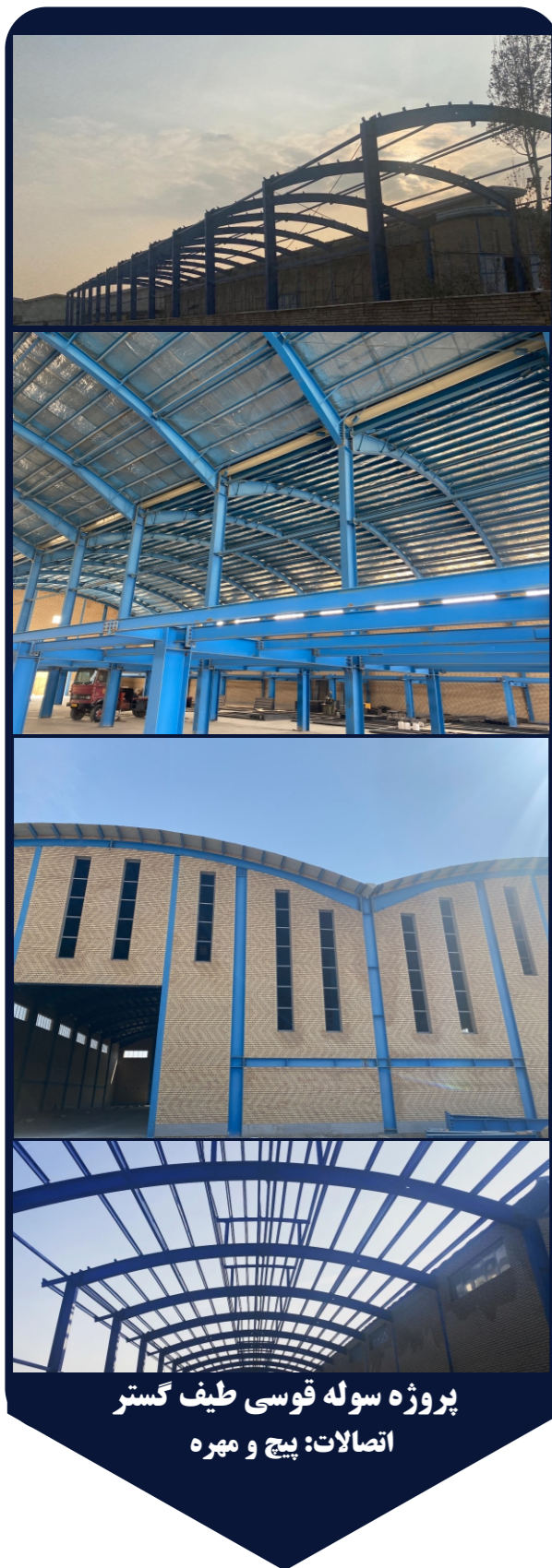
پروژه سوله قوسی طیف گستر اتصالات: پیچ و مهره