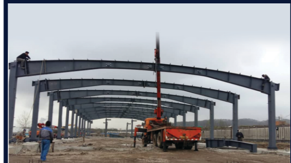
انبار مواد فولاد گیلان اتصالات: پیچ و مهره